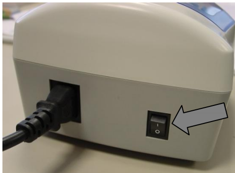
Abbildung 3: Netzschalter

Der Netzschalter ist hinten links an der Rückwand des Gehäuses (siehe Abbildung 3)